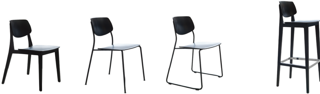
Chaise · Tabouret de bar