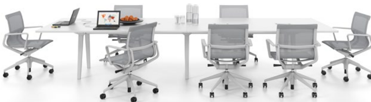
Table de conférence Joyn 320, mélaminé soft light avec électrification Current Rotax. Siège : Physix.