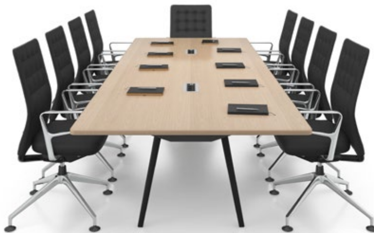
Table de conférence Joyn 320, placage chêne clair avec électrification Current Rotax. Siège : AC 4 Conference.