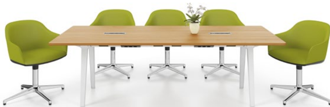
Table de conférence Joyn 240, placage chêne clair avec électrification Current Rotax. Siège : Softshell Chair, piètement quatre branches.