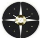
Petal Clock, noir/laiton, Ø 448