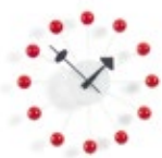
Ball Clock, rouge, Ø 330