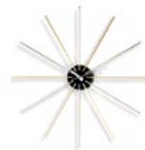
Star Clock, chrome/laiton, Ø 610