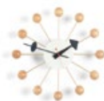
Ball Clock, hêtre, Ø 330