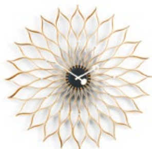
Sunflower Clock, bouleau, Ø 750