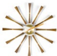
Spindle Clock, aluminium, noyer massif, Ø 577