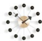
Ball Clock, noir/laiton, Ø 330