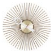
Popsicle Clock, Nussbaum, Ø 350