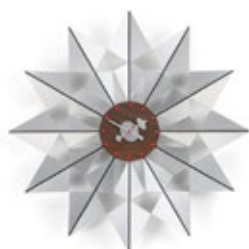
Flock of Butterflies, aluminium, Ø 610