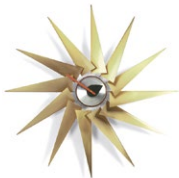
Turbine Clock, laiton/aluminium, Ø 765