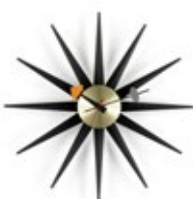
Sunburst Clock, noir/laiton, Ø 470