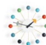
Ball Clock, multicolore, Ø 330