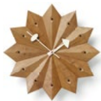
Fan Clock, Kirschbaum (USA), Ø 384