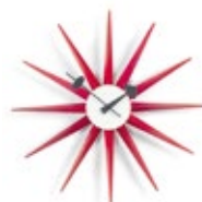
Sunburst Clock, rouge, Ø 470