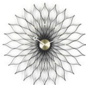
Sunflower Clock, frêne noir/laiton, Ø 750