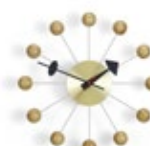
Ball Clock, cerisier, Ø 330