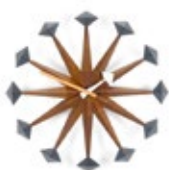
Polygon Clock, noyer, Ø 430