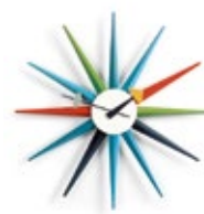
Sunburst Clock, multicolore, Ø 470