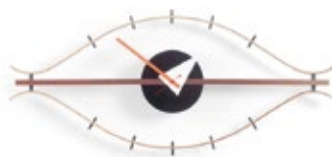
Eye Clock, laiton/noix, H 340 x L 760