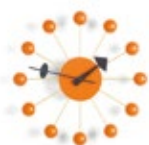
Ball Clock, orange, Ø 330