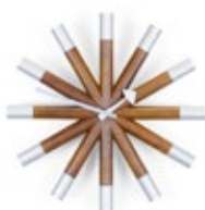
Wheel Clock, noyer/aluminium, Ø 455