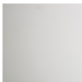
OP71 bianco opaco