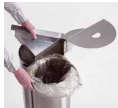
Particolare dell'anello reggi-sacchetto