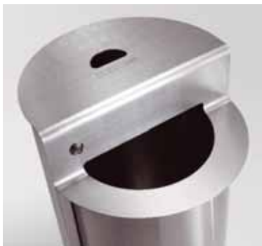
Particolare del coperchio/posacenere