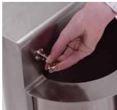
Particolare della serratura