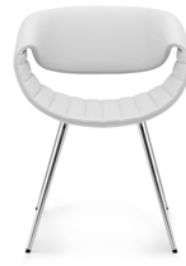
Komplett Leder oder Stoff Full leather or fabric Entièrement en cuir ou en tissu