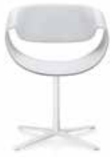
Fusskreuz Cross base Piétement étoile