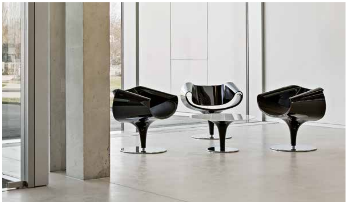
TU München (München, Deutschland) TU Munich (Munich, Germany) Université technique TU München (Munich, Allemagne)