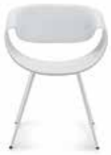
Aluminium Aluminium Aluminium