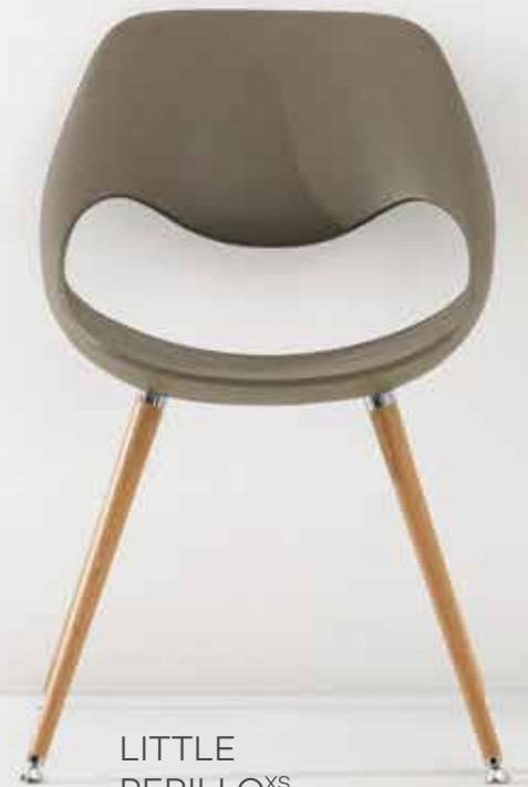
LITTLE PERILLO XS