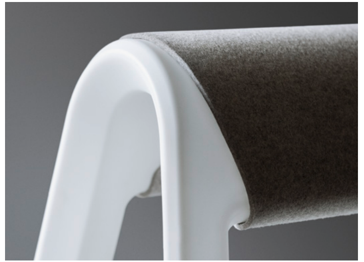
Élément d'aménagement multifonctions assise/appui/support ; hauteur 707 mm, largeur 627 mm, profondeur 520 mm à la base du piétement. Structure en polypropylène teinté dans la masse montée sur patins antidérapants ; en option, tapis de selle en feutre.