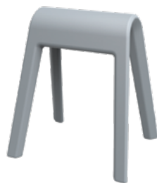
204/03 Sitzbock en gris