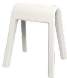
204/02 Sitzbock en blanc