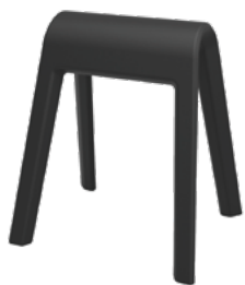
204/01 Sitzbock en noir