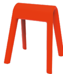
204/04 Sitzbock en rouge orangé