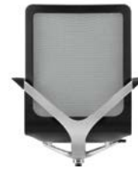
_1 Sitzschale schwarz Coque de siège noire