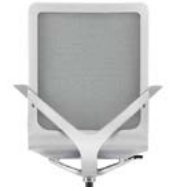
_2 Sitzschale hellgrau Coque de siège gris clair