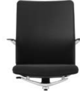
_3 Rücken Polster, Sitz Netz Dossier rembourré, assise résille