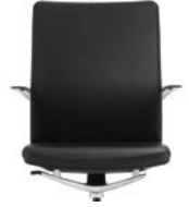
_4 Rücken Polster, Sitz Polster Dossier rembourré, assise rembourrée