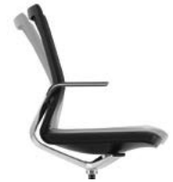
_1 Neigemechanik Mécanisme d'inclinaison