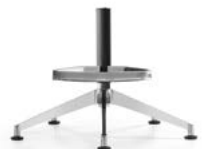
_8 Fünfsternfuss mit Fussbügel, Alu poliert, Rollen | Gleiter Piétement 5 branches avec repose-pieds, alu poli, roulettes | glisseurs