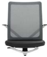
_2 Rücken Netz, Sitz Polster Dossier résille, assise rembourrée