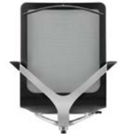
_1 Kleiderbügel Cintre de dossier