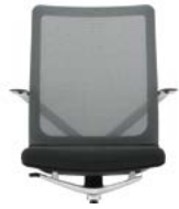
_1 Rücken Netz, Sitz Netz Dossier résille, assise résille