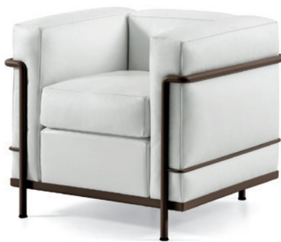
cod. 002 1M marrone / brown / braun / havane