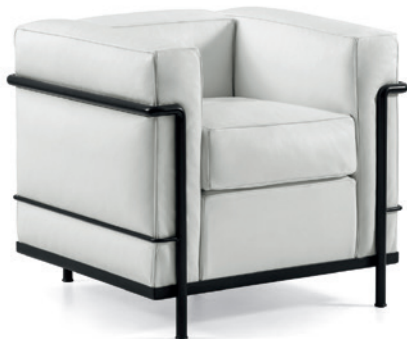
cod. 002 1N nero / black / schwarz / noir