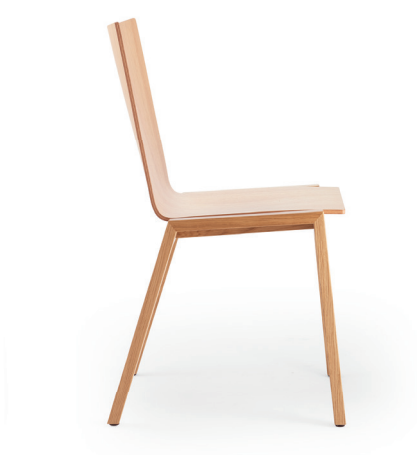
coque 392 | H 830 mm shell 392 | h 830 mm