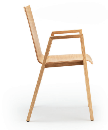
coque 391 | H 860 mm shell 391 | h 860 mm