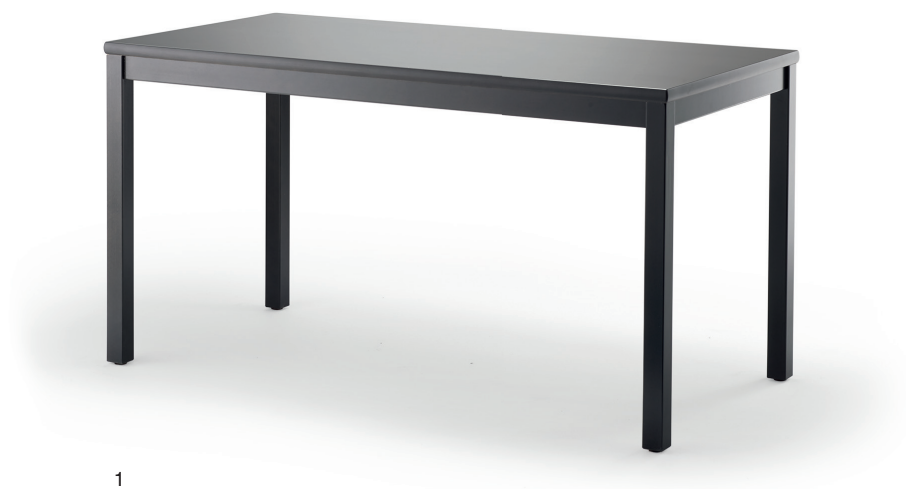
TABLE . TABLE

La table PAN repose sur un piètement à 4 pieds en hêtre, en chêne ou en frêne massif qui peut être assorti au piètement de la chaise. Le plateau est disponible en placage de haute qualité, en stratifié et même en finition laquée mate. La table en bois PAN est proposée en plusieurs dimensions, couleurs et décors ainsi qu'avec divers profils de chants.