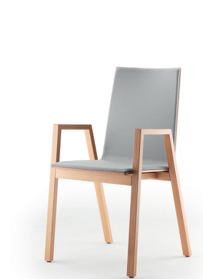
coque 395 | H 920 mm shell 395 | h 920 mm