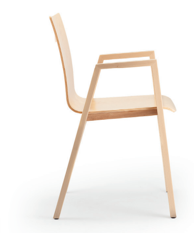
coque 390 | H 830 mm shell 390 | h 830 mm