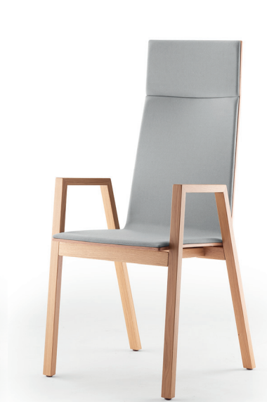
coque 396 | H 1150 mm shell 396 | h 1150 mm