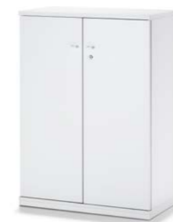
ARMOIRE À PORTES BATTANTES DRAAIDEURKAST