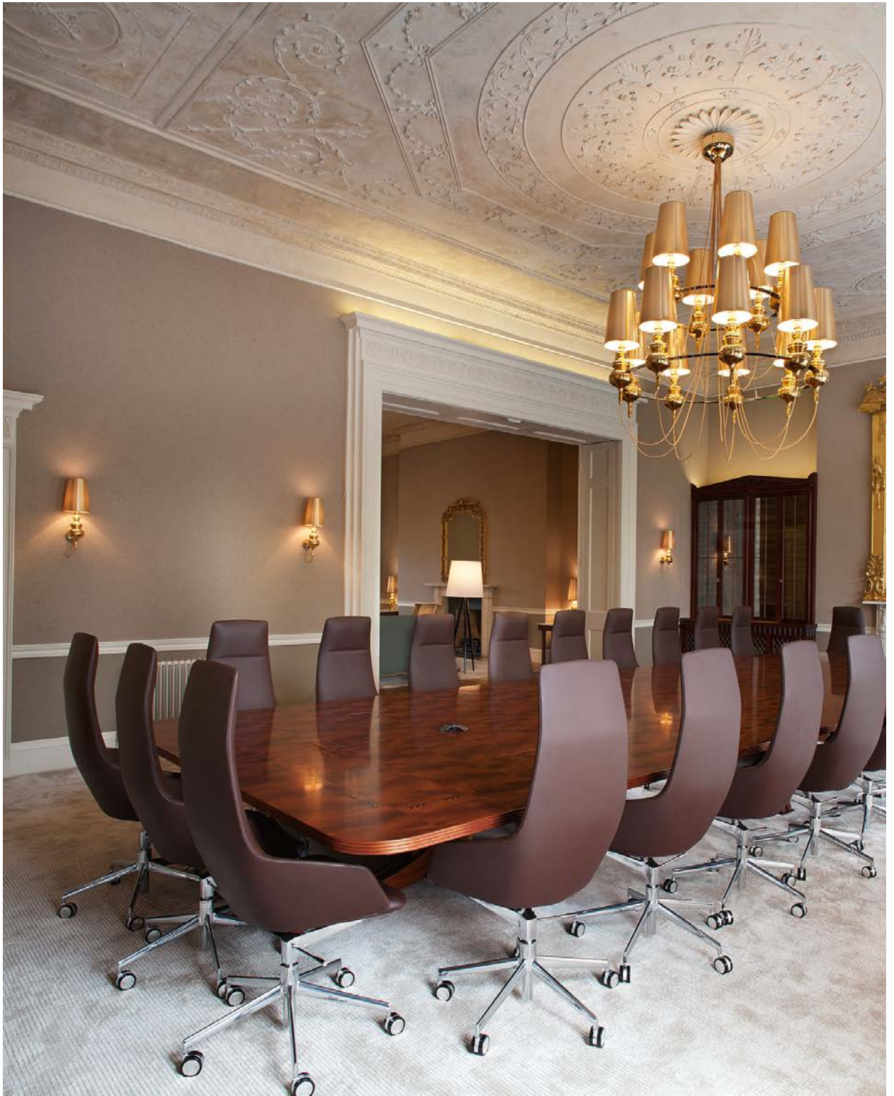
No 8 St. Stephens Green Dublin, Ireland Art. 1924 Direction