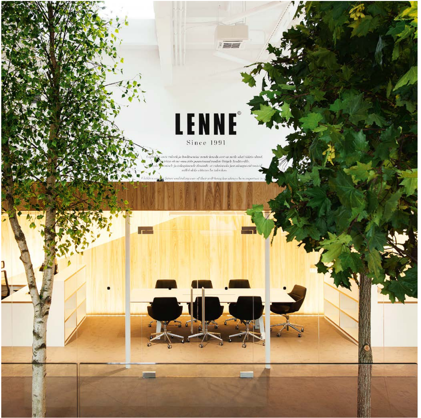
Lenne HQ Tallinn, Estonia Art. 1933 Conference